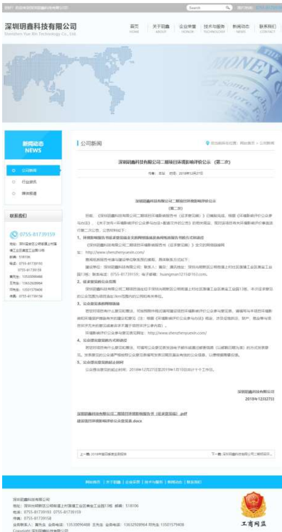
图 2 征求意见稿网络公示截图