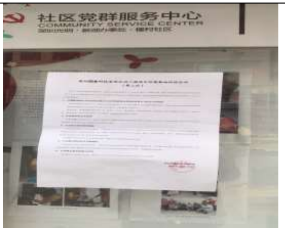
楼村居委会公告栏粘贴照片