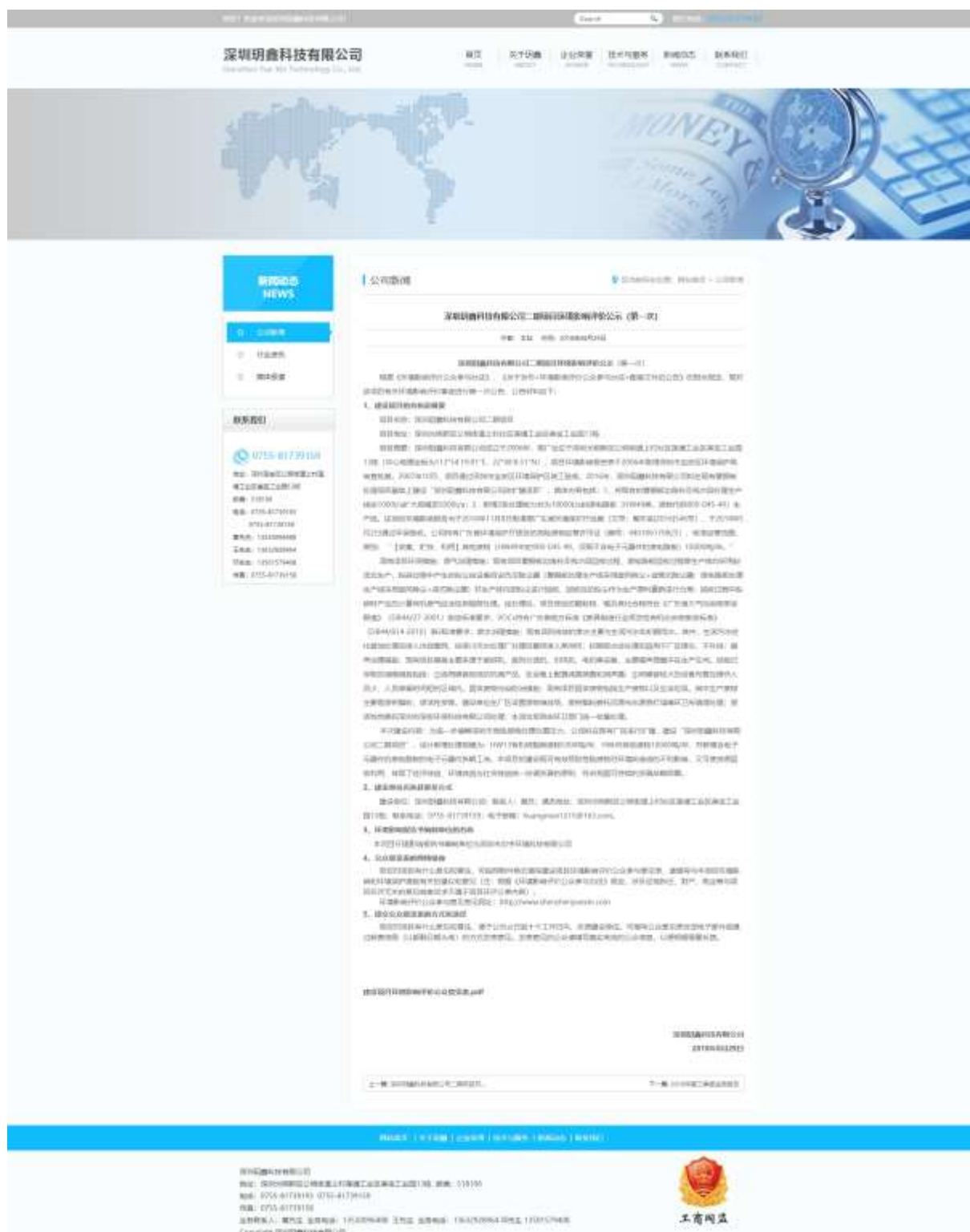
图1 首次环境影响评价信息网络公开截图

众参与办法》要求，网络公示时间为2018年8月29日，至今未撤销网络公示，网址为： http://www.shenzhenyuxin.com/show-17-18.html ，网络公开情况截图如下：