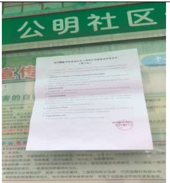
公明社区居委会公告栏粘贴照片