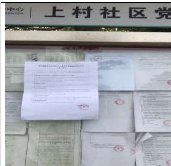
上村居委会公告栏粘贴照片

会公告栏、西田居委会公告栏、下村居委会公告栏、楼村居委会公告栏、李松荫居委会公告栏、公明社区公告栏。照片如下所示：