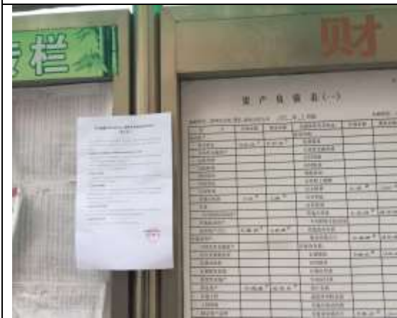
西田居委会公告栏粘贴照片