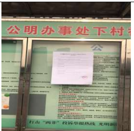
下村居委会公告栏粘贴照片